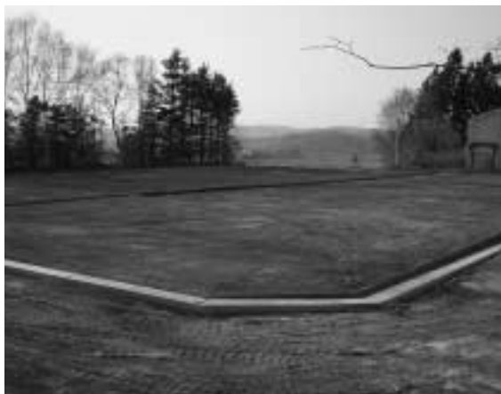
住 所：法師岡字林ノ後

福地村の東側に位置し、北高岩駅(青い森鉄道)から徒歩15分以内という立地条件。また、八戸市内に車で15分、八戸駅には10分という通勤に最適なところです。