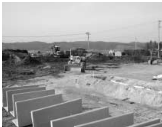
住 所：福田字小沢田

福地村のほぼ中央に位置し、保育所、児童館、幼稚園、小・中学校から徒歩10分以内という立地条件。また、近くには、駐在所、分遣所もあり、安心・安全なところです。